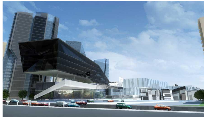
Lilanz Creative Center Jinjiang China

Sebuah desain dengan konsepsi eklektik yang memberikan nuansa modern terhadap perkembangan sebuah desain / creative center sekaligus menjadi pusat aktifitas yang mampu memberikan sebuah potensi positif bagi perkembangan kawasan.