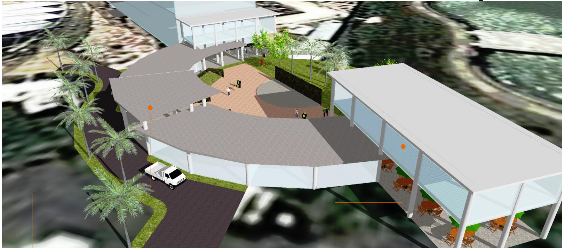
● Lobby & Drop Off Area