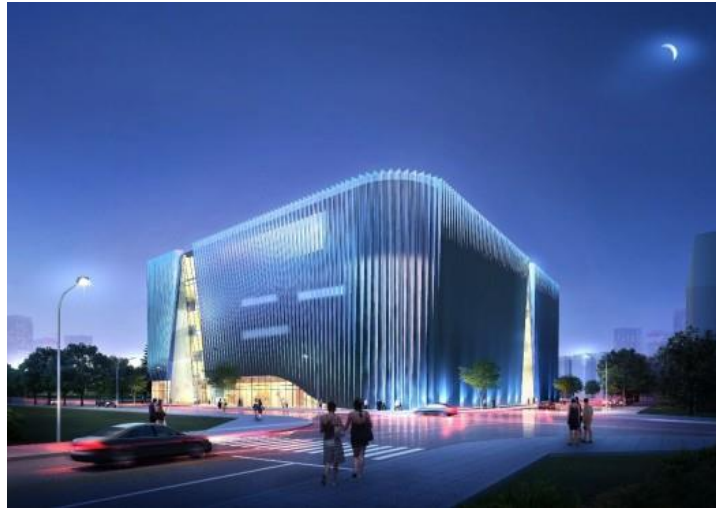
Southwest International Ethnic Culture And Art Center, China