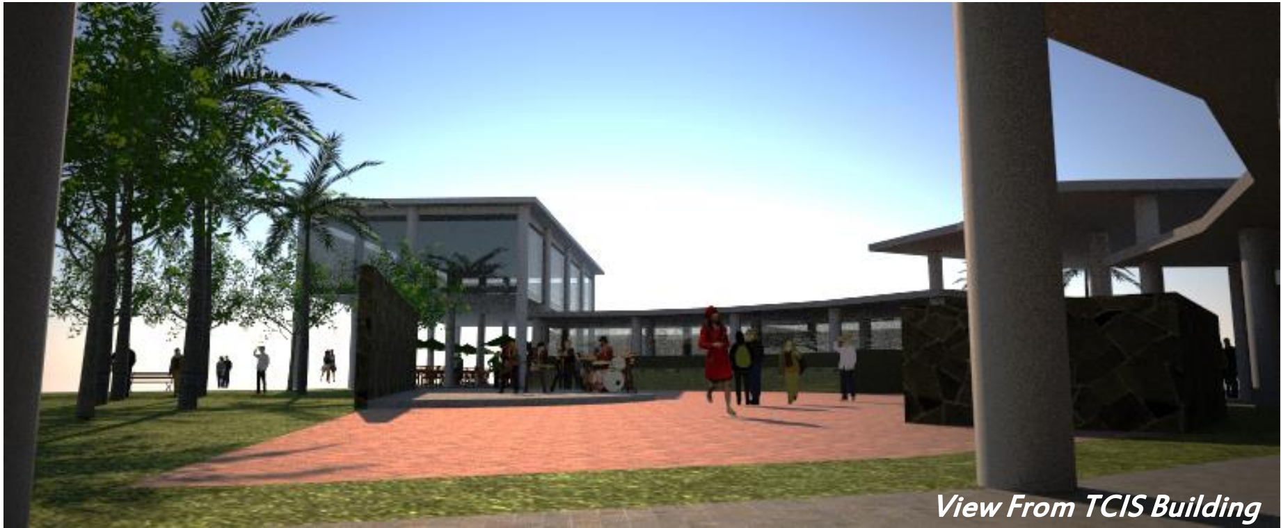
View From TCIS Building