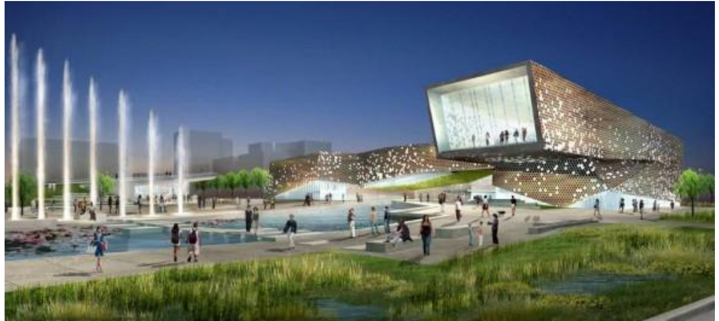
Civic Cultural Exhibition and Activity Center, Korla China