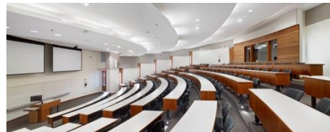
Multimedia Class Room 2 nd Floor Multimedia Class Room